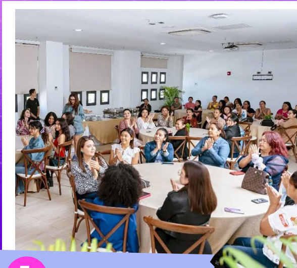
1 Coffe Break