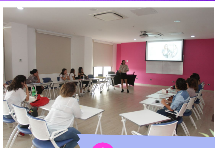
2 Material Digital